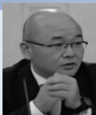
中国西北政法大学 行政法学院 専任講師