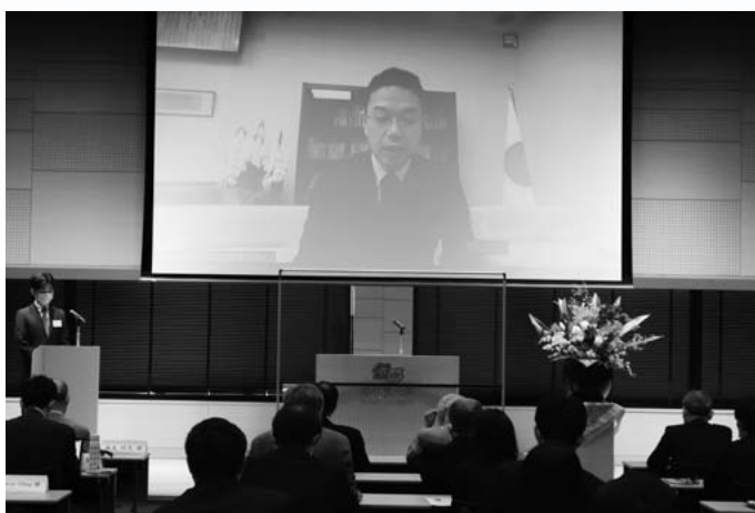
当日式典での祝辞

CALEおよび日本法教育研究センターの取り組みは、国際的な学生交流の推進とグローバル人材育成に資するとともに、昨今の複雑で厳しい国際情勢の中で、自由・民主主義・基本的人権・市場経済そして法の支配といった価値観を国際社会に浸透・共有する重要なものと理解しております。国際社会とりわけアジアの平和と安定のために、名古屋大学の取り組みを、今後もぜひ維持・発展させていただきたいと思っております。