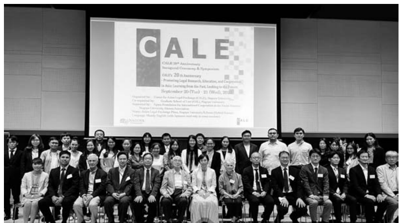
CALE20周年記念シンポジウムでの集合写真