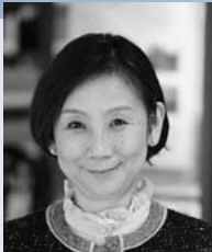
名古屋大学 法政国際教育協力 研究センター長