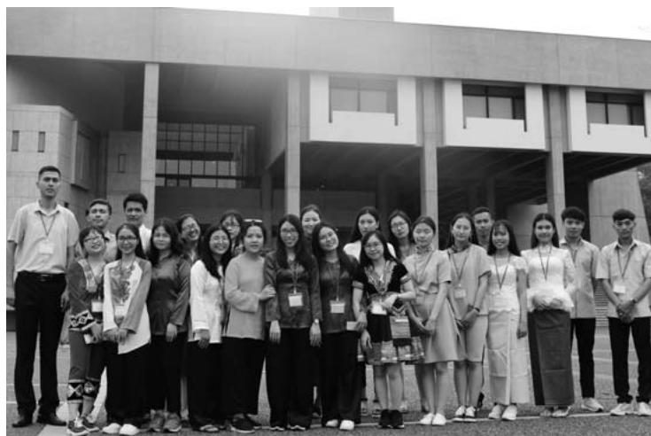
2019年度のCJL夏季セミナー