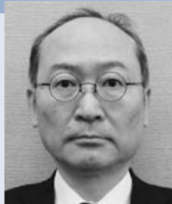
法務省 法務総合研究所長