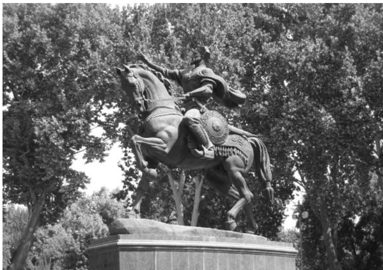
アムール・ティムール像

た、真にウズベキと対話ができるのは日本だという反応で、私としても面目躍如でした。