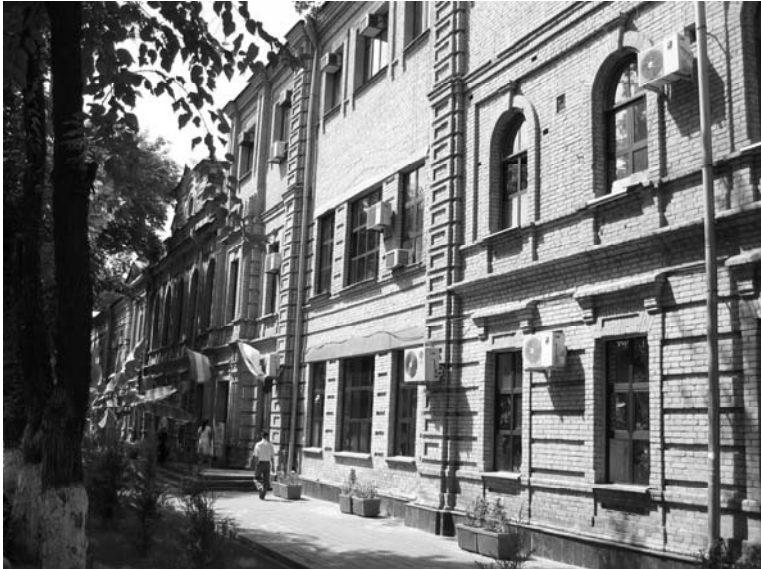
タシケント国立法科大学

来ています。最近、ウズベクでも韓流といいますか、「冬のソナタ」を放送していますが、「何で日本のドラマを見せてくれないのか」と言われるぐらい、日本に対する関心が強いです。